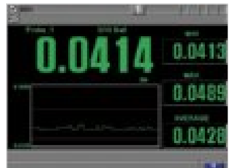
带有统计数据的带状图视图