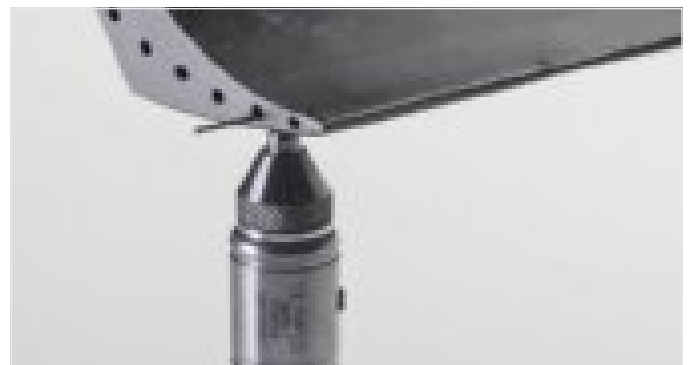
使用目标钢线对涡轮叶片进行测量

目标钢线可被插入到涡轮叶片的冷却孔中，而较大的磁性目标钢珠可用于测量最厚达25.4毫米的喷气式引擎部件。