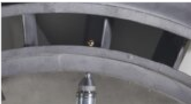
对24.1毫米的航天器铸件进行测量

Magna-Mike已被成功地应用于航空航天领域的质量控制程序中，对由复合材料及非铁性材料制成的航空航天器的各个部件进行测量。